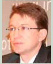
CARTE DE VIZITĂ

În comunicații, se pare că lucrurile sunt stabile. În sectorul bancar, relativ stabile. Da, remitențele au scăzut, însă, panică nu există, nu se retrag masiv depozitele. Afacerile curente merg normal. Retail-